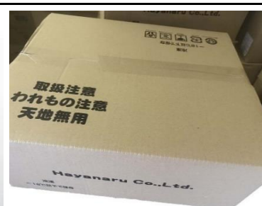
ケース(配送段ボール)